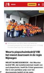
Weurts piepschuimbedrijf VBI het meest duurzaam in de regio Nijmegen WEURTSALUMEGENMOOK - Het Weurts bedrijf VBI, dat isolatiemateriaal maakt van oud piepschuim, heeft De Cirkel gewonnen. Dit is een jaarlijkse prijs voor het duurzaamste bedrijf uit de regio.

Er zijn grote regionale ambities en er is een behoefte aan een triple helix uitvoeringsorganisatie die ook strategisch meedenkt en bepaalt. Kiezen voor vergroting van de impact en efficiency heeft invloed op de structuur en financiering. In dit document zijn de bestuurlijke ambities verder uitgewerkt.